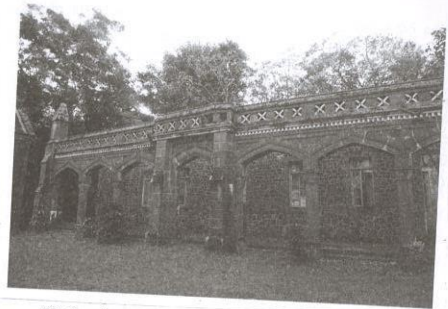
03. ඡායාරූපය - කන්ද උඩරට සිරකරුවන් මූර්සි දිවයිනේ තේවාසිකව සිටි ගොඩනැගිල්ල (වර්තමාන තත්ත්වය)

1818 අගෝස්තු - සැප්තැම්බර් වන විට නිදහස් සටන සම්පූර්ණයෙන්ම අසාර්ථකත්වය පත් වීමේ ස්වභාවයක් දිස් වූ නිසා ඇතැම් සටන් නායකයන් ගත් තීරණය වූයේ ඉංග්‍රීසින්ගේ නිවේදන අනුව යටත් වීමයි. අකුරුකඩුවේ මොහොට්ටාල 1818 සැප්තැම්බර් මස 20 වන දින තවත් පස් දෙනෙක් සමග ද, එදින ම පලාගොල්ලේ මොහොට්ටාල ද, අමුණුමුල්ලේ මොහොට්ටාල ඔක්තෝම්බර් 14 දින ද, මාලියද්දේ මොහොට්ටාල ඔක්තෝම්බර් 24 දින ද, කම්බුවටුවන මොහොට්ටාල ඔක්තෝම්බර් 29 වන දින ද, කදුලව ලොකු මොහොට්ටාල නොවැම්බර් 20 දින ද වශයෙන් සටන් නායකයන් ෫ සක් ඉංග්‍රීසින්ට ස්ව කැමැත්තෙන්ම යටත් වී තිබේ. 50 තවත් පිරිසක් ප්‍රධාන සටන් නායකයන් ඉංග්‍රීසින්ට හසු වී මරණීය දණ්ඩනයට පවා ලක්ව, සටන නිමාවට පත්ව