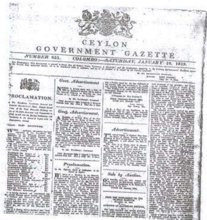
01. ඡායාරූපය - කැප්පෙට්පොළ ඇතුළු උඩරට ප්‍රධානීන් කැරැලිකරුවන් ලෙස නම් කරමින් නිකුත් කළ ගැසට් නිවේදනය (1818 ජනවාරි 10)

සටන් අතර මරණයට පත් වූ අතර 22 , තවත් පිරිසකට ඉංග්‍රීසීන් විසින් අල්ලා මරණීය දණ්ඩනය පැන වූහ. තවත් පිරිසක් බන්ධනාගාර ගත කිරීම හෝ රටින් පිටුවහල් කිරීම සිදු විය. ඇතැම් සටන් නායකයන් සදාකාලිකවම සැඟවුණු ජීවිතයක් ගත කළහ. ඇතැම් අවස්ථාවල දී මොවුන්ගේ දේපළ ආදිය කොල්ල කා ඇති අතර ගිනිතබා විනාශ කිරීම ද සිදුව තිබේ. 23